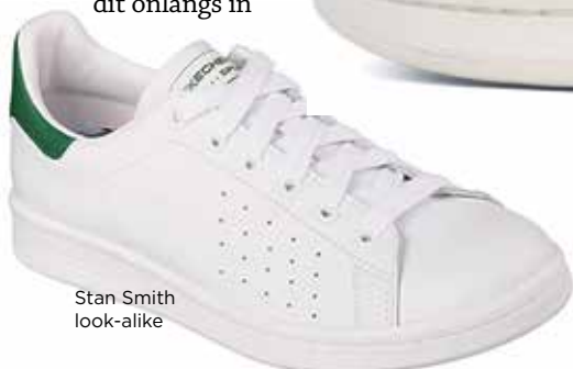
Stan Smith look-alike

hoger beroep nog eens bevestigd. Volgens de rechter maakt Sketchers met zijn Onix model inbreuk op de zogenaamde 'trade dress' - het design en de vorm - van de Stan Smith schoen van adidas.