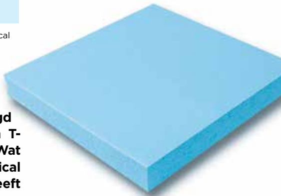
Het blauwe isolatiemateriaal van Dow

Echter, dan moet je de beschermingsomvang van je unieke kleurmerk niet overschatten. Dow maakte op basis van zijn kleurmerk lichtblauw bezwaar tegen een nieuwe registratie van het woordmerk PolyBlue, ook voor isolatiemateriaal. Zowel het merkenbureau als het Hof Den Haag in beroep wees de claim van Dow af: de kleur lichtblauw stemt niet zodanig overeen met het woord PolyBlue dat er gevaar voor verwarring is. En zo loopt Dow een blauwtje.