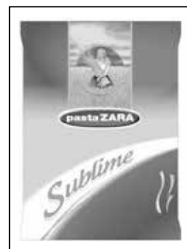
De merkregistratie van pastaZARA