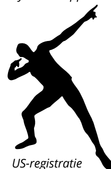
US-registratie 97552042 pose Usain Bolt